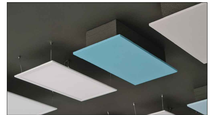
Panele sufitowe i świetlne widok 2.