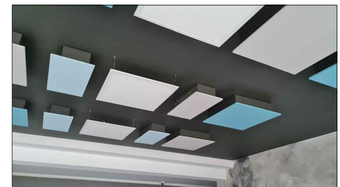
Panele sufitowe i świetlne widok 3.