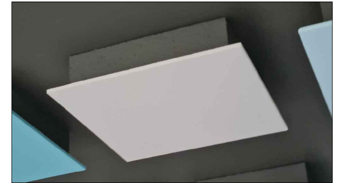
Panele sufitowe widok 1.