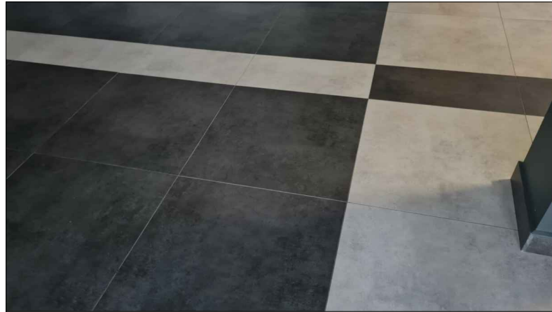
ZESTAWIENIE DWÓCH KOLORÓW PŁYTEK 75X75 JASNEJ I CIEMNEJ