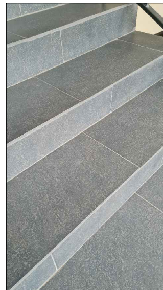
PŁYTKA SCHODOWA ANTYPOSLIZGOWA

PŁYTA Z WEŁNY SKALNEJ PRASOWANEJ GR. 1.5–2cm malowana wg. rysunku nr. 8.